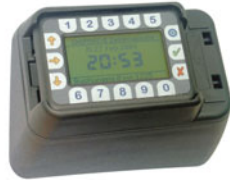
CHIPDRIVE® portátil con soporte de pared

El kit de inicio incluye un atractivo soporte de pared que facilita la utilización estacionaria del equipo de gestión de tiempo.